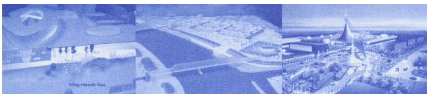
Von links nach rechts: Spielbank Duisburg Rheinpark Hochfeld MultiCasa